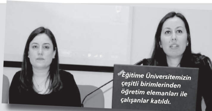
Eğitime Üniversitemizin çeşitli birimlerinden öğretim elemanları ile çalışanlar katıldı.

lemler almak, ihtiyacınızdan fazla malzeme, kimyasal madde vb. almamak, oluşan tüm atıkları doğru sınıflandırmak, ambalaj atıkları, evsel atıklar, tıbbi atıklar ile tehlikeli atıkları birbirine karıştırmamak ve geri kazanılabilir atıkları birbirleriyle karıştırmamak."