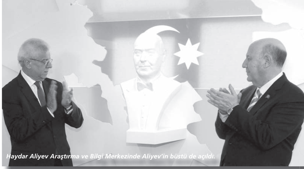
Haydar Aliyev Araştırma ve Bilgi Merkezinde Aliyev'in büstü de açıldı.

Tarih boyunca Avrupa ülkelerinin yaşayış ve bütünleşme serüvenlerinden söz eden Erhan, şunları söyledi: "Bütünleşme yolundaki adımları 3 şekilde kategorize ediyoruz. Bunlar ekonomik, uluslararası ve hukuki bütünleşmedir. AB bütünleşmesi sürecinde bu üçü birlikte kullanılmıştır. Ekonomik bütünleşme için ekonominin tek bir sektöründe başlayan ve yaratılan karşılıklı bağımlılık ve işlevsellik sonucu diğer sektörlerde yayılan ve ardından siyasi bütünleşmeye doğru götürecektedrici bir bütünleşme modelidir diyebiliriz. II. Dünya Savaşı'nın son dönemlerinde, elde büyük oranda yıkılmış, hem maddi hem de manevi derin yaralar almış; siyasal, sosyal ve ekonomik zarara uğramış bir Avrupa kıtası bulunmaktadır. Bu dönemde, yeniden bir savaşın tekrarlanmaması ve Avrupa'nın toparlanması için birlik ve hatta 'uluslarüstüçülük' kavramları, Avrupa'nın derdine çare olacak ilaç gibiydiler ve 1940'ların sonunda yeni bir Avrupa hareketini başlatmıştır. Türkçe'de 'uluslarüstüçülük' olarak kullanılan 'supranationalism' kavramı geliştirilmiştir. Uluslarüstüçülük, ulusal hükümetlerin egemenlik haklarını, hukukları ve politikalarını bu hükümetler üzerinde bağlayıcı olan uluslarötesi kurumlarla paylaşmaları sürecidir. Bu hareket ekseninde hareket eden İngiliz devlet adamı Winston Churchill, AB'nin temellerini atan Schuman ve Monet'den önce, Avrupa Konseyi çalışmaları sırasında 'Avrupa Birleşik Devletleri' adıyla barış ve Avrupalılık vurgusu ile Avrupa birleşmesinden de bahsetmiştir."