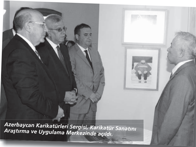
Azerbaycan Karikatürleri Sergisi, Karikatür Sanatını Araştırma ve Uygulama Merkezinde açıldı.

Protokol, her iki üniversitede ortak yarar sağlayabilecekleri alanlarda eğitim ve araştırma konularında iş birliği yapmak için gayret sarf edilmesi, makûl olan ölçüler içinde kardeş iki üniversitenin öğretim üyeleri, araştırma kurumları ve öğrenciler arasında doğrudan bağlantı ve iş birliğini teşvik edilmesi amacını taşıyor. Protokol ay-