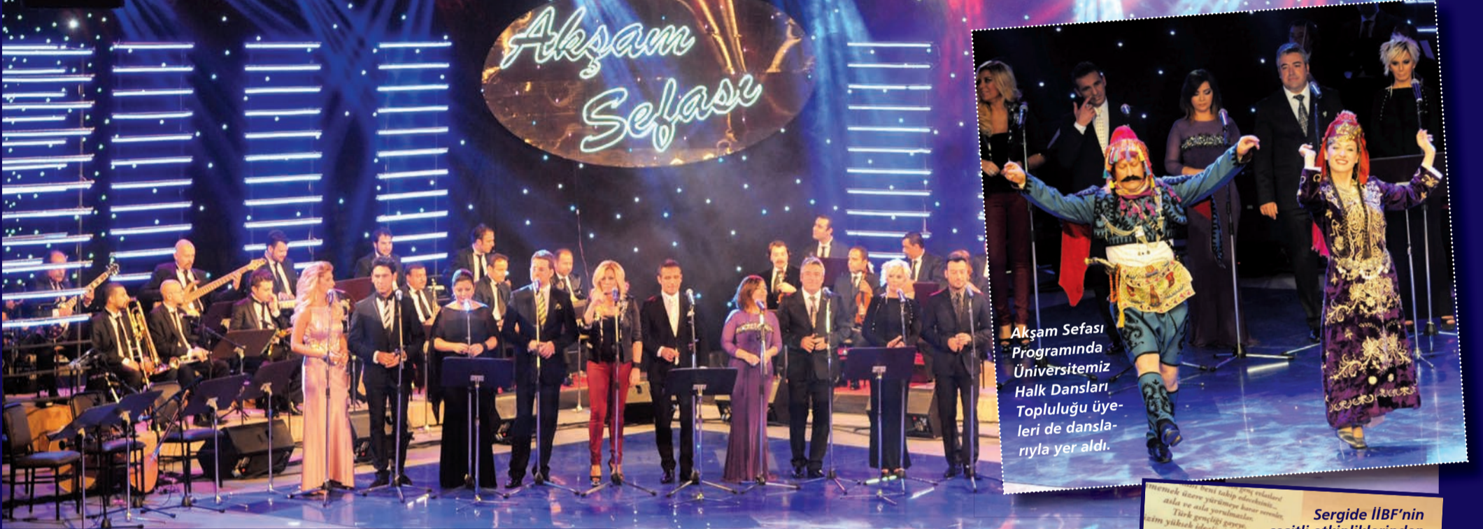
Akşam Sefası Programında Üniversitemiz Halk Dansları Topluluğu üyeleri de danslarıyla yer aldı.