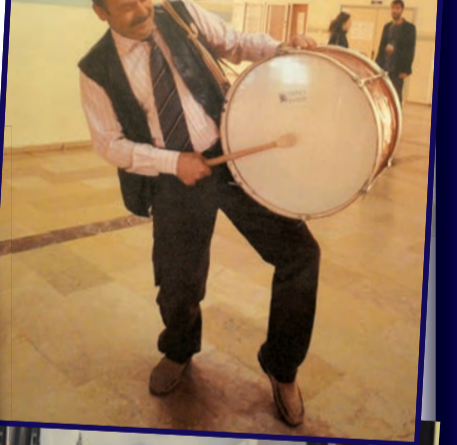
Sergide İİBF'nin çeşitli etkinliklerinden fotoğraflar yer alıyor.

■ İktisadi ve İdari Bilimler Fakültesi (İİBF) tarafından 2 Eylül günü, İİBF Sergi Salonu'nda gösterime açılan "İİBF Öğrencisinin 365 Günü" konulu fotoğraf sergisi sanatseverlerle buluştu. Fakültede öğrenimini sürdüren öğrencilerin yanı sıra yeni kayıt yaptıran öğrencilere, nasıl bir fakülteye geldiklerinin ipuçlarını veren sergide, farklı etkinlikler sırasında öğretim elemanları, muhabirler ve öğrenciler tarafından ölümsüzleştirilen anlar konuklarla buluşuyor.