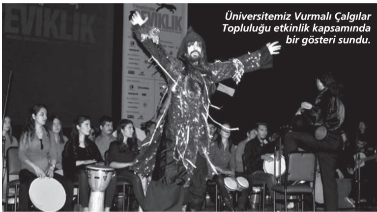
Üniversitemiz Vurmalı Çalgılar Topluluğu etkinlik kapsamında bir gösteri sundu.

Eskişehir KalDer yöneticimiz Burak Bey ile de iş birliklerimiz için protokol anlaşması imzaladık. Kendisine huzurlarınızda tekrar teşekkür ediyoruz." diye konuştu.