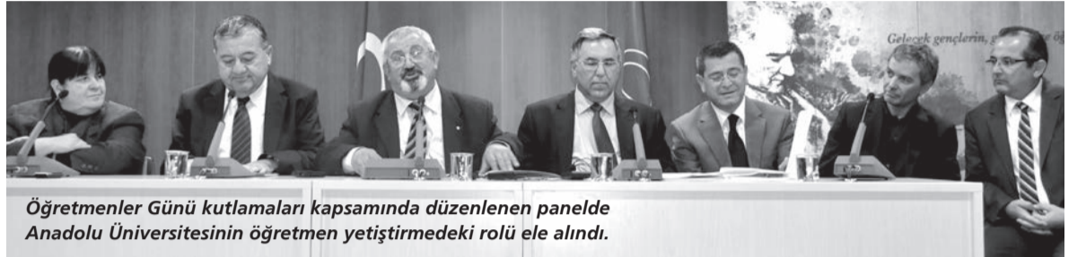
Öğretmenler Günü kutlamaları kapsamında düzenlenen panelde Anadolu Üniversitesinin öğretmen yetiştirmedeki rolü ele alındı.