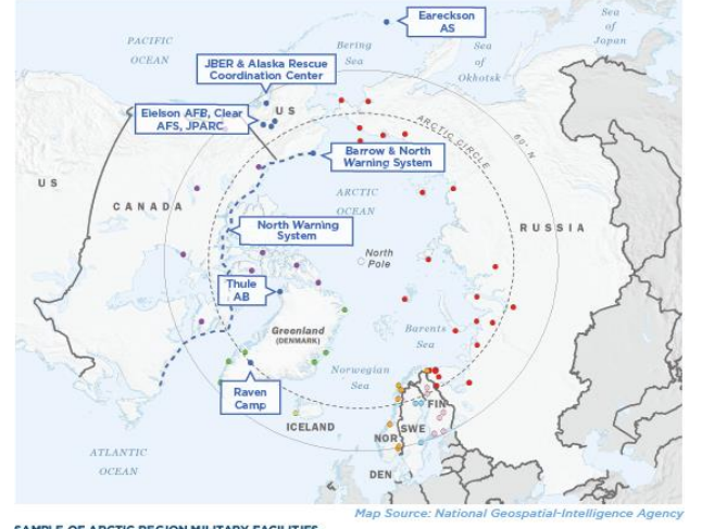
Şekil 4: Arktika Bölgesinde Askeri Tesisler

SAMPLE OF ARCTIC REGION MILITARY FACILITIES