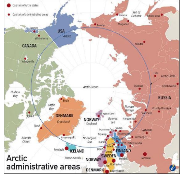
Şekil 3: Arktika Bölgesi Devletleri

Arktik konusunu bölgesel ülkeler ya da bölge dışı ülkeler kapsamına indirgemek basit kalabilir. Zira bölgede kıyası olsun ya da olmasın Arktik'e bir şekilde taraf olan ülkelerin üye olduğu uluslararası kuruluşlar bölgede yaşanan ve yaşanılacak olan olaylarında habercisi diyebiliriz. Teorik olarak açıklamak gerekirse, ülkelerin kendi kimliklerinden ziyade üyesi oldukları uluslararası kuruluşları da bağlayan bazı kararlar alması atılan adımları bölgesellikten çok uzaklaştırarak yine bir dünya problemi haline getirebiliyor. Olaylara geniş çerçeveden bakıldığında bu bölgenin tarafsız ilan edilmesinin bir stratejisi olarak bu kimlik perspektifinden düşünülmüş olabileceğini söylememiz gerekmektedir.