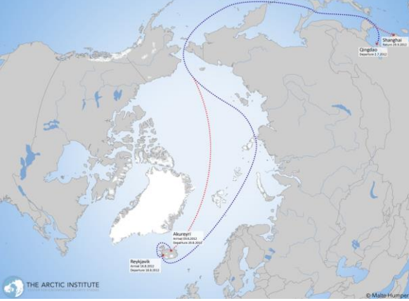
Şekil 6: Çin- Arktik Deniz Yolu