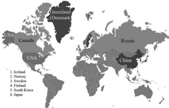
Şekil 1. Arktik ve Arktik Dışı Ülkeler