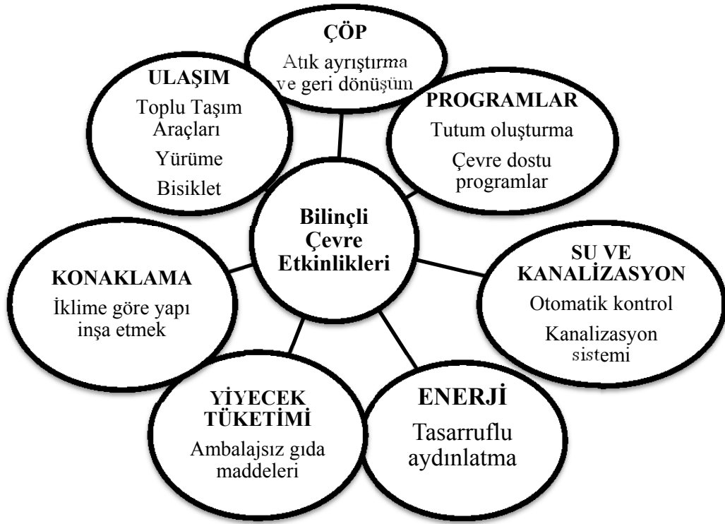
Şekil 1: Bilinçli Çevre Etkinlikleri