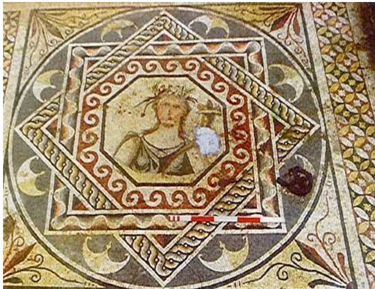
Şekil 7. Bereket Tanrısı Demeter (Zeugma)