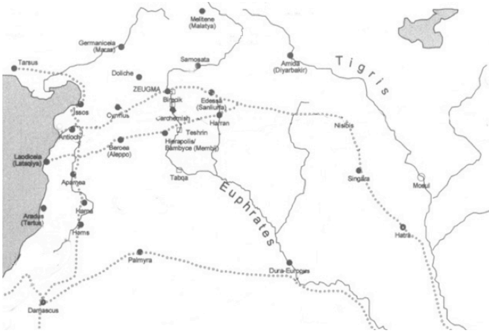
Şekil 3. (Bölgeden geçen ticaret yolları)