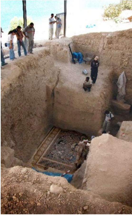
Şekil 5. (Zeugma)