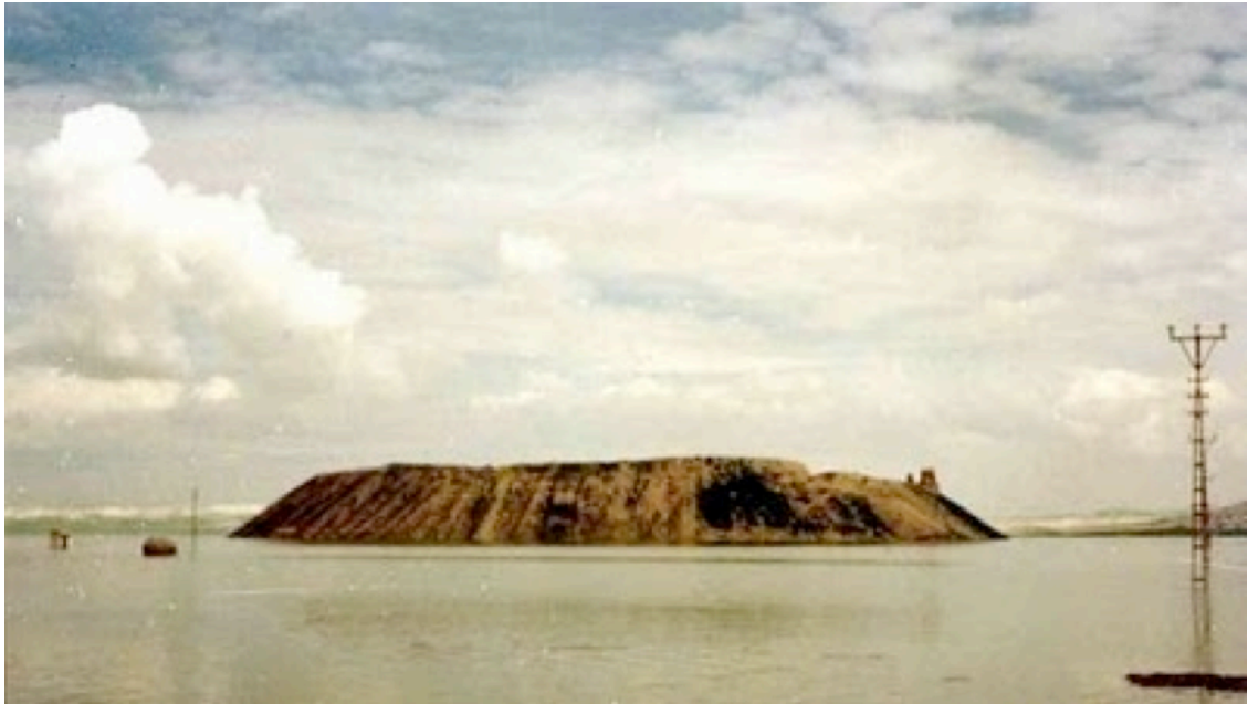
Şekil 4. (Samosata Antik Kenti)