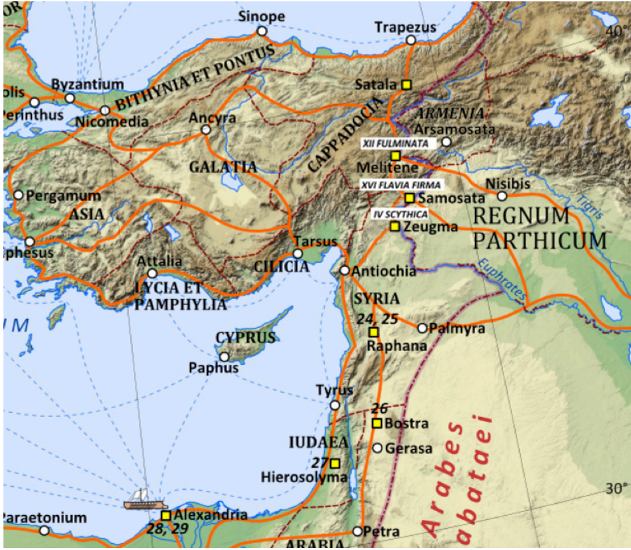
Şekil 1. (Fırat Nehri Hattındaki Lejyonlar)