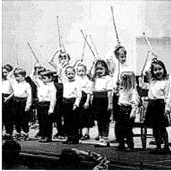
Resim 7. Roket Oyunu