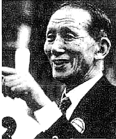
Resim 1. Shinichi Suzuki