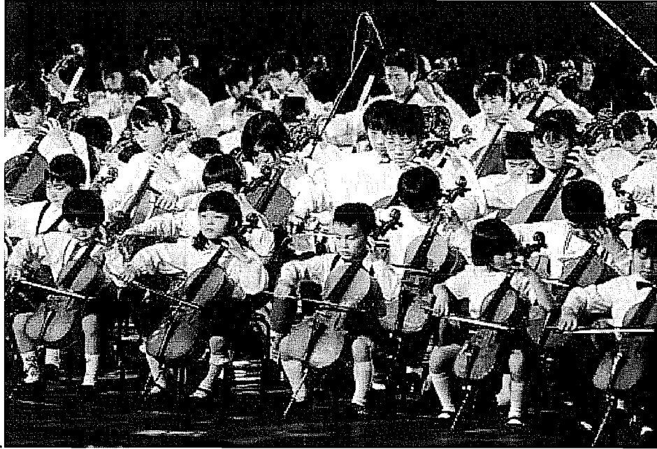
Resim 3. Suzuki Çello Öğrencileri

Suzuki bilgi ve yetenek arasındaki farkın altını önemle çizmiş ve bir şeyi bilmenin yetenek anlamına gelmediğini, çocukların yeteneğe zaten öğrendikleri bir şeyi tekrar ederken ulaştıklarını savunmuştur. Suzuki metodunda ilerlemek için aceleyle gerek yoktur ve çocuğun çalabildiği parçaları tekrar tekrar çalmasına izin vermek onun yeteneğinin gelişmesi açısından önemlidir. İleri parçalara geçmek için acele etmek çocuğun gelişimini başarısızlığa uğratabilir. Suzuki metodunda öğrencilerden profesyonelleşmeye başladıklarında bile şimdiye kadar çaldıkları repertuvaya geri dönmeleri istenebilir. Çünkü Suzuki, dili yada kültürü ne olursa olsun dünyanın her yerinden öğrencilerin bir araya gelip birlikte çalmalarını sağlamaktadır. “Tekrar” ın en heyecan verici yararlarından biride budur.