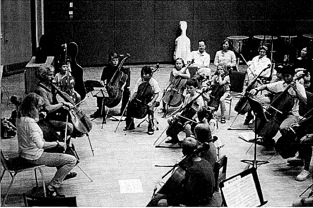
Resim 4. Ebeveynlerin de Katıldığı Toplu Ders