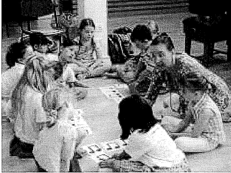
Resim 6. Suzuki Öğrencilerinin Ritim ve Nota Çalışması

öğrencinin diğer alanlardaki dikkati dağılabilir. Geç gösterildiğinde ise, öğrencinin diğer alanlarda tökezlemesine neden olur. Dolayısıyla nota okuma becerisi, doğru zamanda adım adım ve dikkatli uygulanmalıdır.