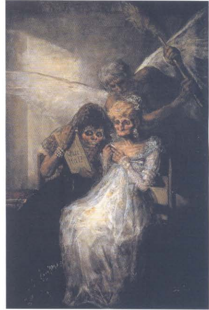
Goya, "Les Vieilles ya da Zaman ve Yaşlı Kadın", Güzel Sanatlar Müzesi, Lille, 1810-1812.