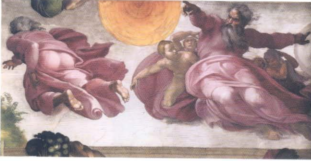
Michelangelo, "Güneş, Ay ve Gezegenlerin Yaratılışı", Sistina Şapeli, Vatikan, 1511.