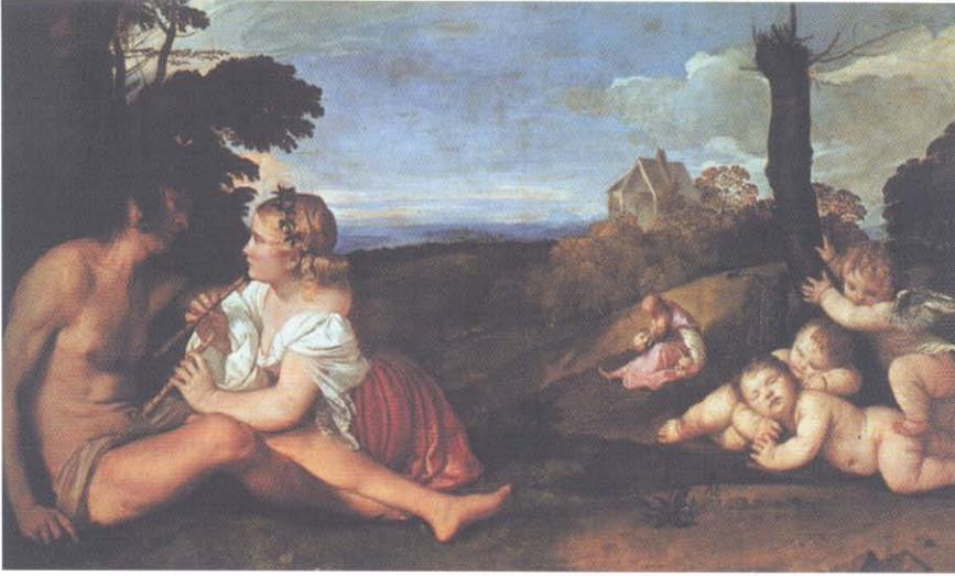
Tiziano, "Insanlığın Üç Çağı", Scotland Ulusal Galerisi, Edinburg, 1511-1512.