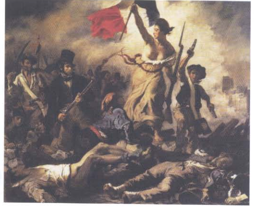
Delacroix, "Halka Önderlik Eden Özgürlük", Louvre Müzesi, Paris, 1830.

tirdiği görülür. Barok resmin genel özelliklerinden biri olan anlık görüntü, bu resimde "Sütçü Kız"ın yaptığı eylemle pekiştirilmiştir. Ayrıca, sütün "gerçek hayattaki dökülüş süresi"yle "resimdeki dökülüş süresi" karşılaştırıldığında birbirinden farklı olduğu görülecektir. Sütün resimdeki dökülüş süresi, 1658'den gelecekte bilinmeyen bir an'a kadardır denilebilir.