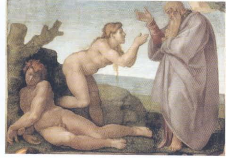
Michelangelo, "Havva'nın Yaratılışı" Sistina Şapeli, Vatikan, 1509-1510.

lerde yer kabuğunun değişimlerine işaret eden jeolojik zamanı, teolojik zamanla ifade etmeye çalışmıştır.